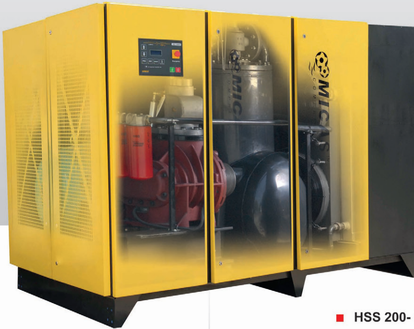
■ HSS 200- B