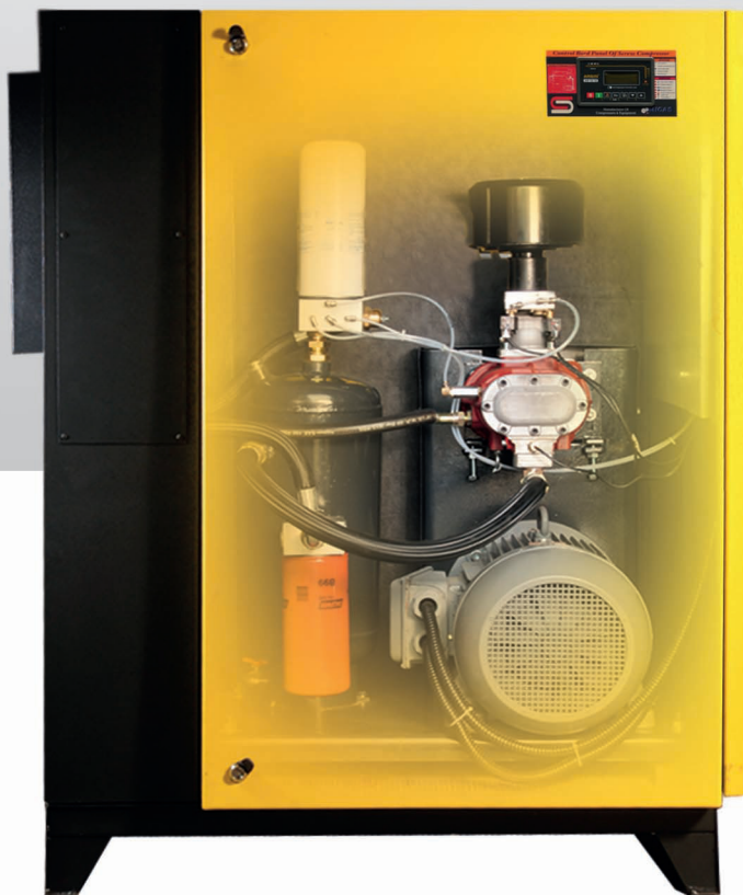
■ HSS 11-22 B