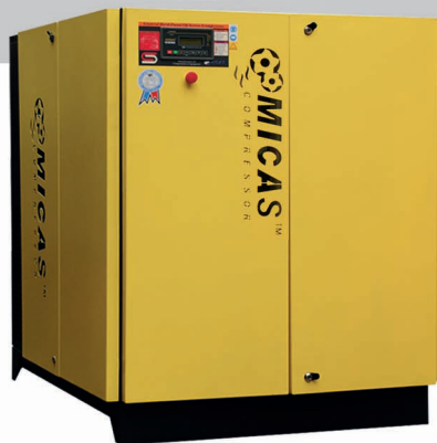
■ HSS 30-B / HSS 75-B