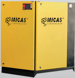
■ HSS 11-B / HSS 22-B