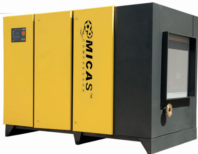
■ HSS 90-B / HSS 350-B