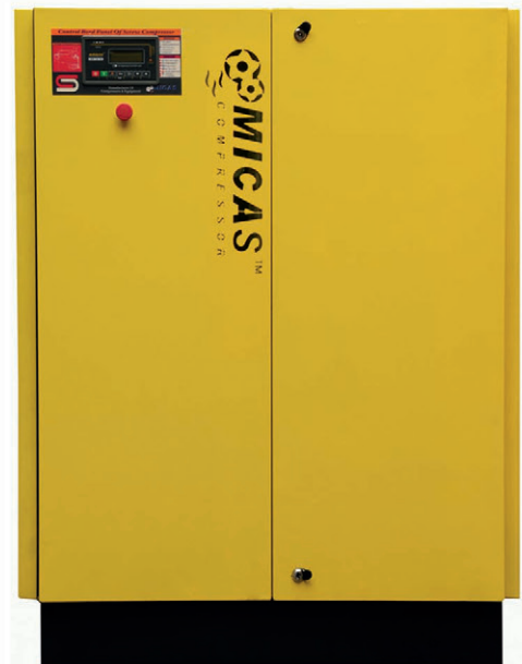
■ HSS 11-22 B